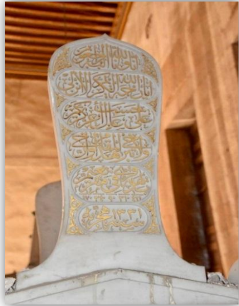
لوحه (١) شاهد قبر الأميرة بديهة هانم