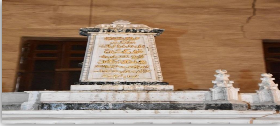
لوحة (3) شاهد قبر الأميرة قدرية