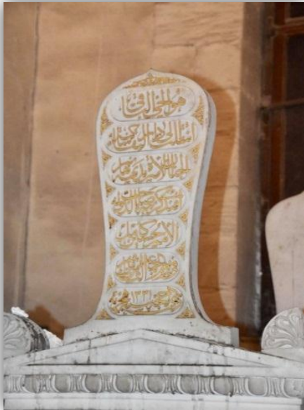
لوحه (٢) مضاهى شاهد قبر الأميرة بديهة هانم