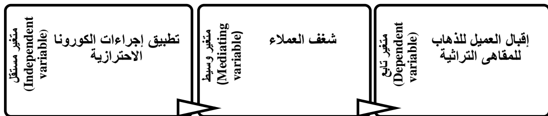
شكل (1) إطار البحث

يعتقد الباحثين أن هناك ضرورة لتناول أثر أزمة الكورونا على المقاهى ذات الطابع التاريخى الشعبية التراثية فى مدينة القاهرة.